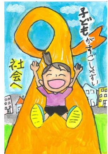
第11回(令和3年度) 小学生以下の部 優秀作品