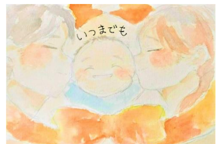
第11回(令和3年度)中学生以上の部 優秀作品

2004年、栃木県小山市で3歳と4歳の兄弟が父親の友人から再三にわたって暴行を受け、橋の上から川に投げ込まれて命を奪われるという痛ましい事件をきっかけに、全国でオレンジリボン運動が始まりました。オレンジリボンは、子ども虐待をなくす運動の象徴です。