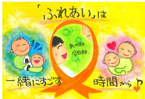
第11回(令和3年度)中学生以上の部 最優秀作品